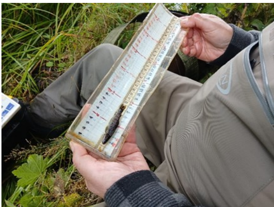
Taimenpoikasia havaittiin tällä kertaa kaikilla Sunnanån mittauspisteillä.