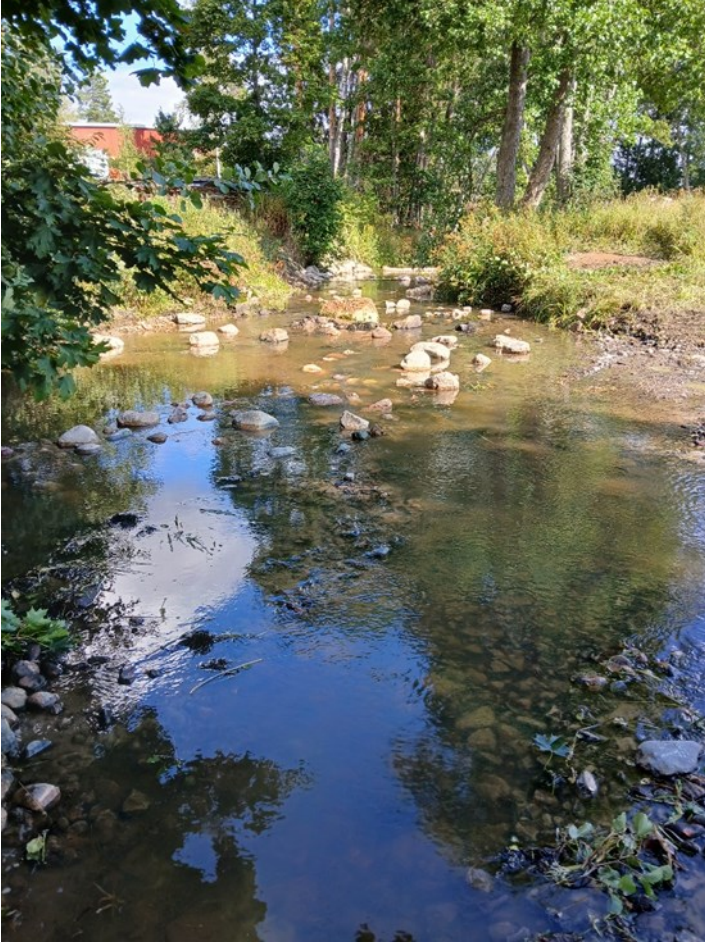
Valmiiksi rakennettu alue Nyborgin kohdalla.